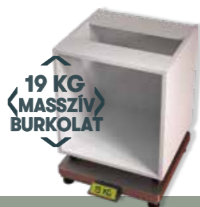
18 mm vastag, stabil korpusz

A 18 mm vastag oldalfalak, a 150 mm-es összekötőelem és a nagyobb súly teszik a DANKÜCHEN korpuszt rendkívül stabilá.