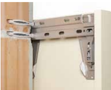
Biztonságos, dupla felfüggesztésű felső szekrények

A porózus falak és a fugák nem nyújtanak elegendő tartást a hagyományos rögzítéshez. A dupla felfüggesztő sínrel ellátott felső szekrények gondoskodnak a biztonságról.